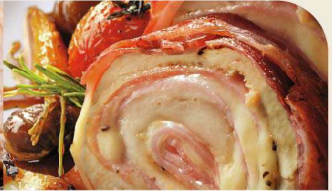
Arrollado de pollo con jamón y queso el Kg. (1 Kg. equivale a 6 porciones) Gs. 69.900