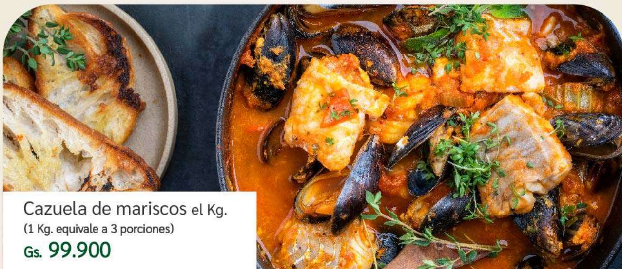
Cazuela de mariscos el Kg. (1 Kg. equivale a 3 porciones) Gs. 99.900