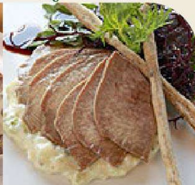
Lengua con salsa tártara la un. (1 un. equivale a 4 porciones) Gs. 25.900