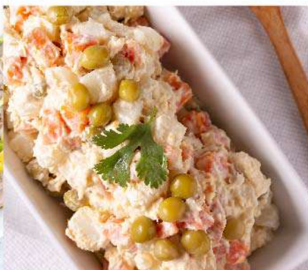
Ensalada rusa el Kg. (1 Kg. equivale a 5 porciones) Gs. 29.900