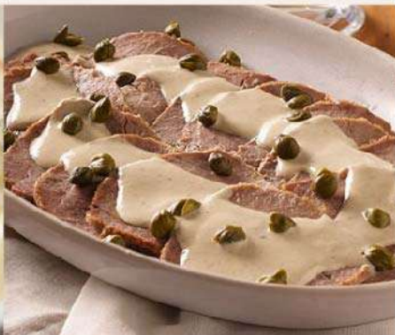
Lengua con salsa vitel toné la un. (1 un. equivale a 4 porciones) Gs. 25.900