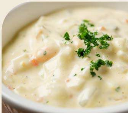
Salsa tártara el Kg. (1 Kg. equivale a 10 porciones) Gs. 24.900