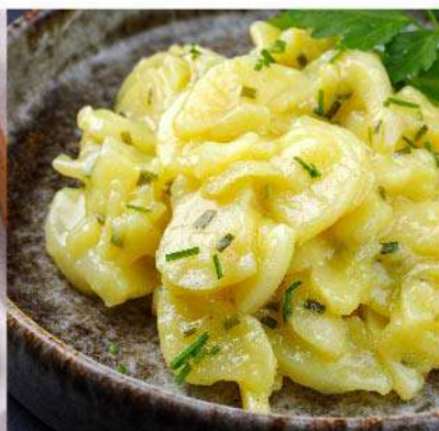
Ensalada alemana el Kg. (1 Kg. equivale a 5 porciones) Gs. 29.900