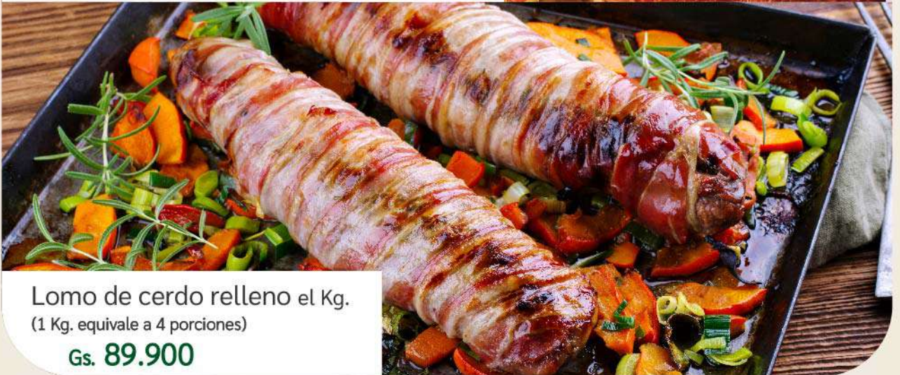
Lomo de cerdo relleno el Kg. (1 Kg. equivale a 4 porciones) Gs. 89.900

Podés comprar llamando al 021 41 41 960 o haciendo el pedido con hasta 24 hs. de anticipación en nuestros locales.