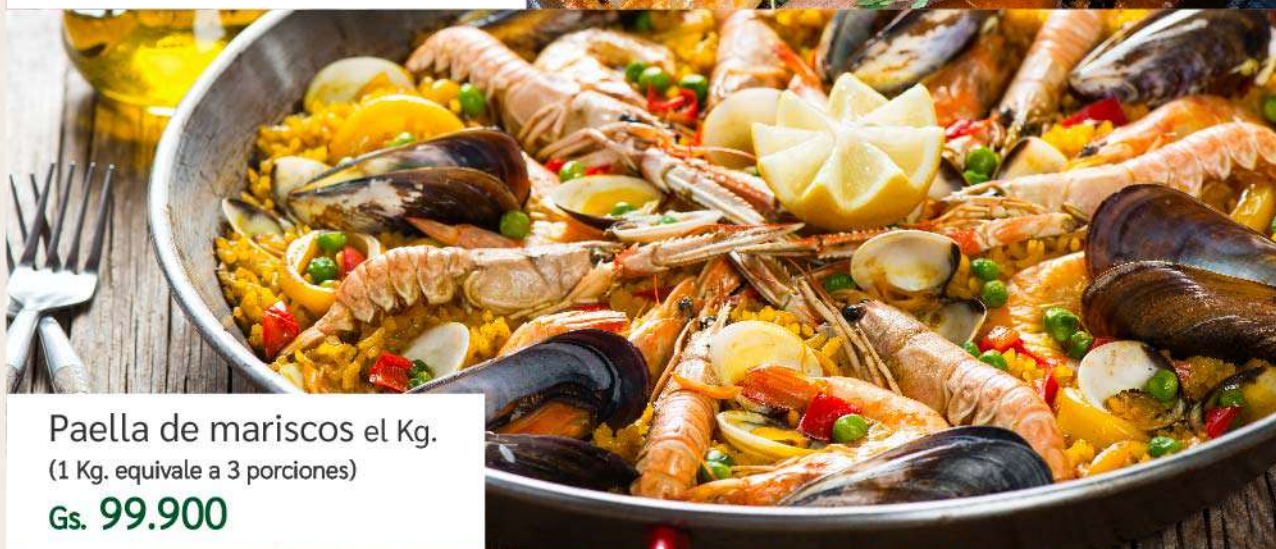
Paella de mariscos el Kg. (1 Kg. equivale a 3 porciones) Gs. 99.900