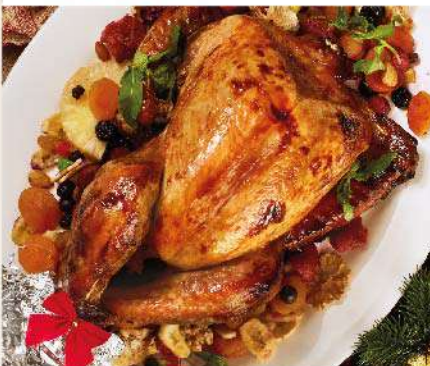
Pavita decorada el Kg. (1 Kg. equivale a 6 porciones) Gs. 129.900