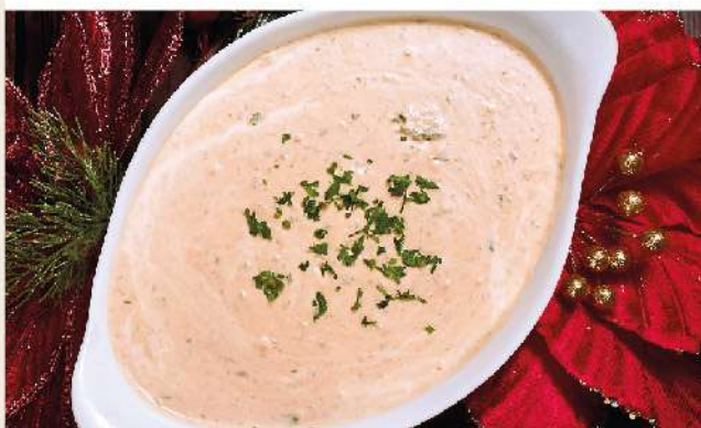
Salsa vitel toné el Kg.