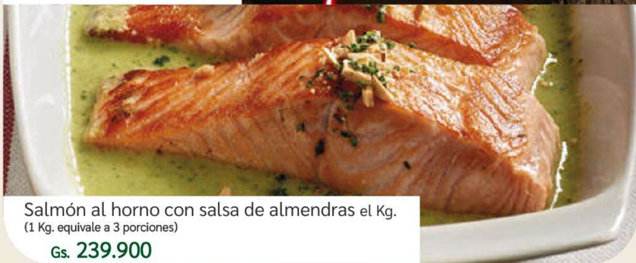
Salmón al horno con salsa de almendras el Kg. (1 Kg. equivale a 3 porciones) Gs. 239.900

Podés comprar llamando al 021 41 41 960 o haciendo el pedido con hasta 24 hs. de anticipación en nuestros locales.