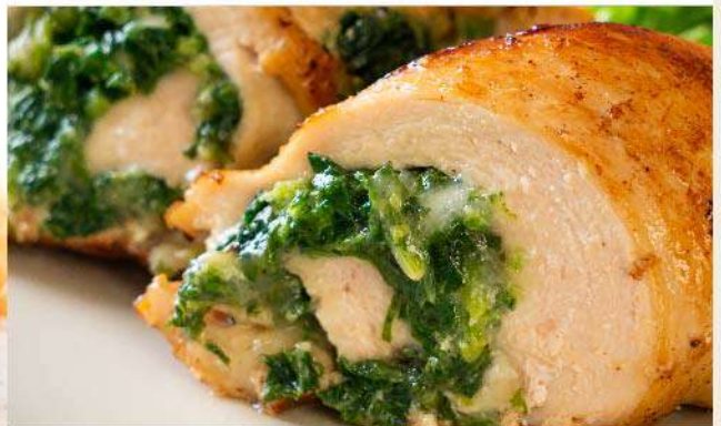
Pechuga de pollo rellena con verduras el Kg. (1 Kg. equivale a 6 porciones) Gs. 69.900