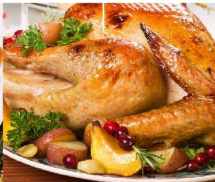
Pavita rellena con frutas el Kg. (1 Kg. equivale a 6 porciones) Gs. 129.900