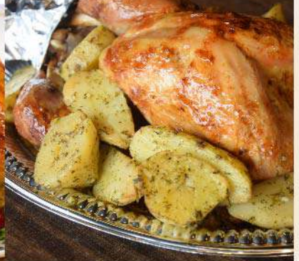
Pavita a las finas hierbas con papas a la provenzal la un. (1 Un. equivale a 6 porciones) Gs. 359.000

Podés comprar llamando al 021 41 41 960 o haciendo el pedido con hasta 24 hs. de anticipación en nuestros locales.