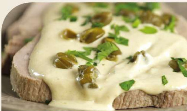
Peceto con salsa vitel toné la un.