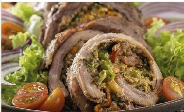
Arrollado de matambre con verduras el Kg.