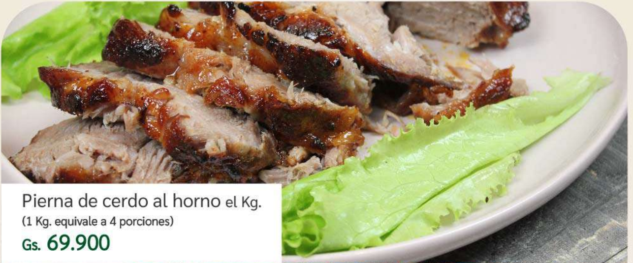
Pierna de cerdo al horno el Kg. (1 Kg. equivale a 4 porciones) Gs. 69.900