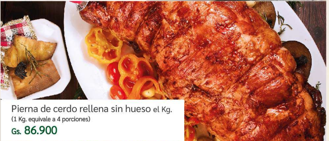
Pierna de cerdo rellena sin hueso el Kg. (1 Kg. equivale a 4 porciones) Gs. 86.900