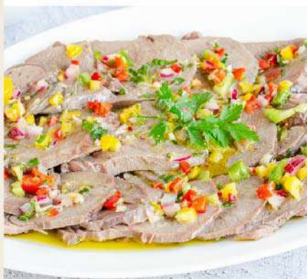
Lengua a la vinagreta la un. (1 un. equivale a 4 porciones) Gs. 25.900