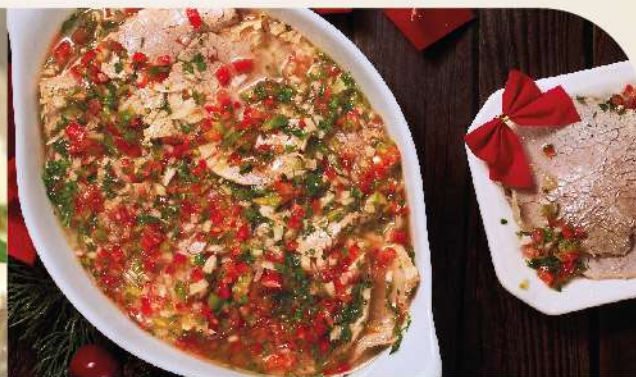
Peceto a la vinagreta la un.