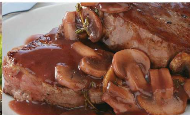
Peceto al champignon el Kg.