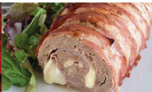
Arrollado de matambre con jamón y queso el Kg.