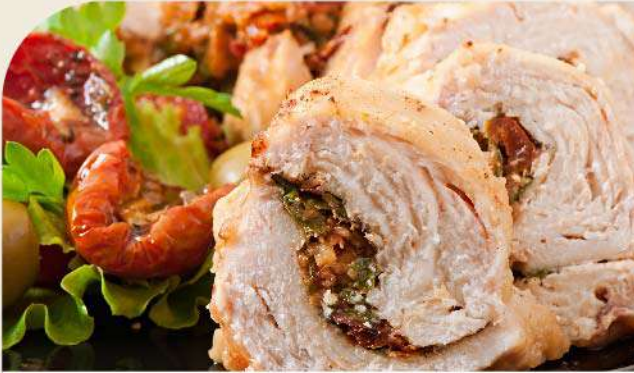
Arrollado de pollo el Kg. (1 Kg. equivale a 6 porciones) Gs. 69.900