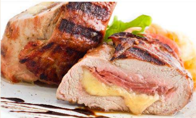
Pechuga de pollo rellena con jamón y queso el Kg. (1 Kg. equivale a 6 porciones) Gs. 69.900